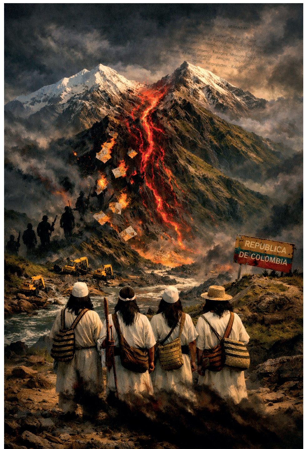
Imagen: Generada con IA

En un futuro cercano, cuando se analice este momento, tal vez la historia pregunte: ¿Qué hizo el Estado colombiano cuando el alma de la Sierra Nevada quedó desprotegida? La respuesta dependerá de si el Gobierno transforma sus anuncios en una presencia real o si permitirá que la montaña más sagrada del país sea definida, una vez más, por las fuerzas que siempre han decidido por ella: las balas, el mercado y el abandono.