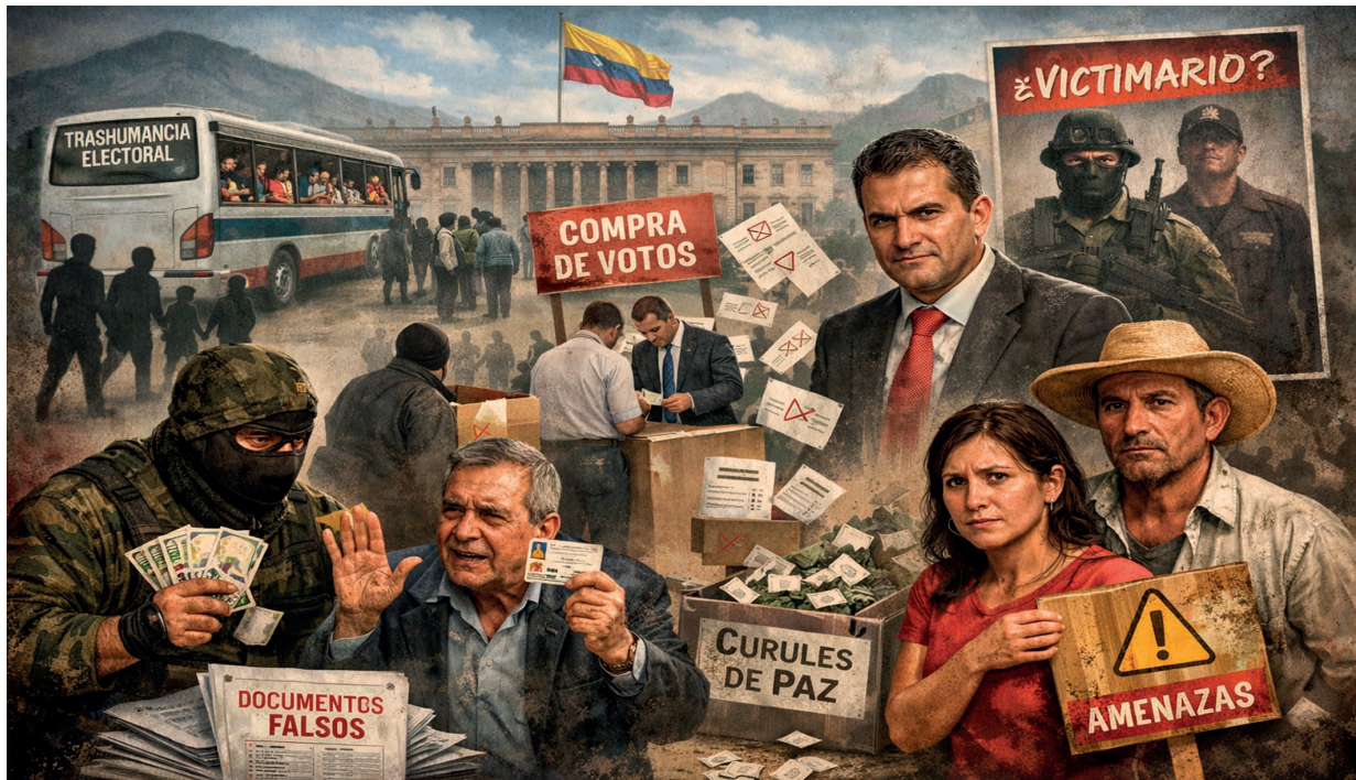
Imagen: Generada con IA

Por: Corresponsalías Populares Meta - Guaviare