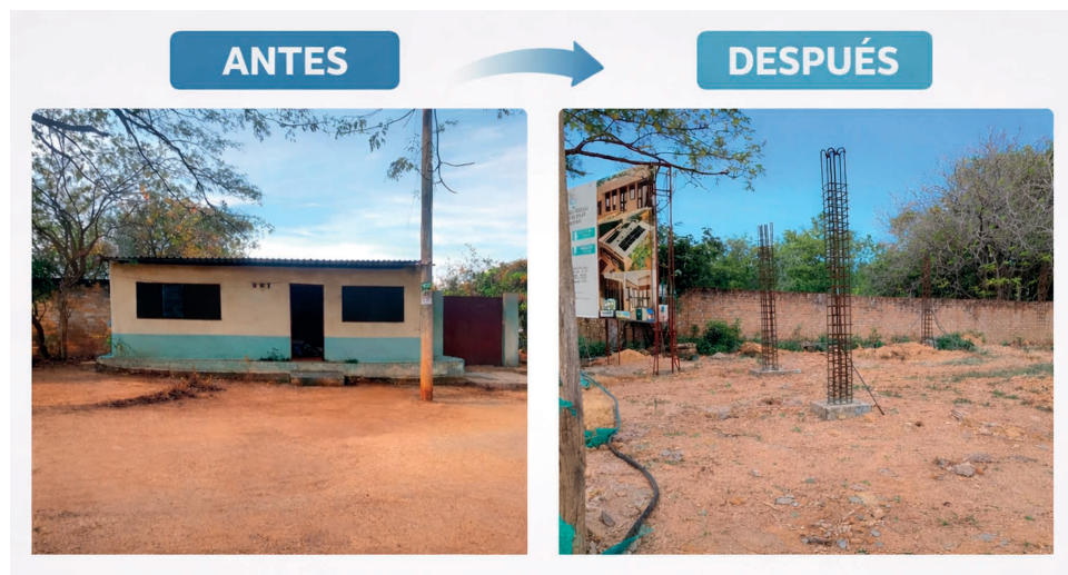
Imagen: Generada con IA

Entre promesas gubernamentales y obras detenidas, comunidades de La Guajira como Guayaacanal esperan una atención médica que no llega