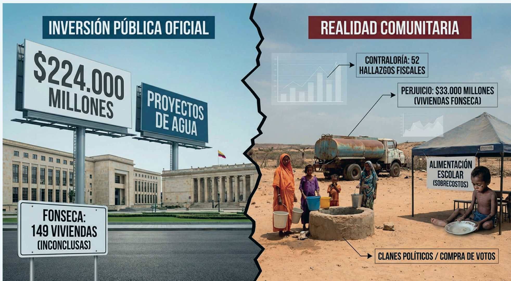
Imagen: Generada con IA