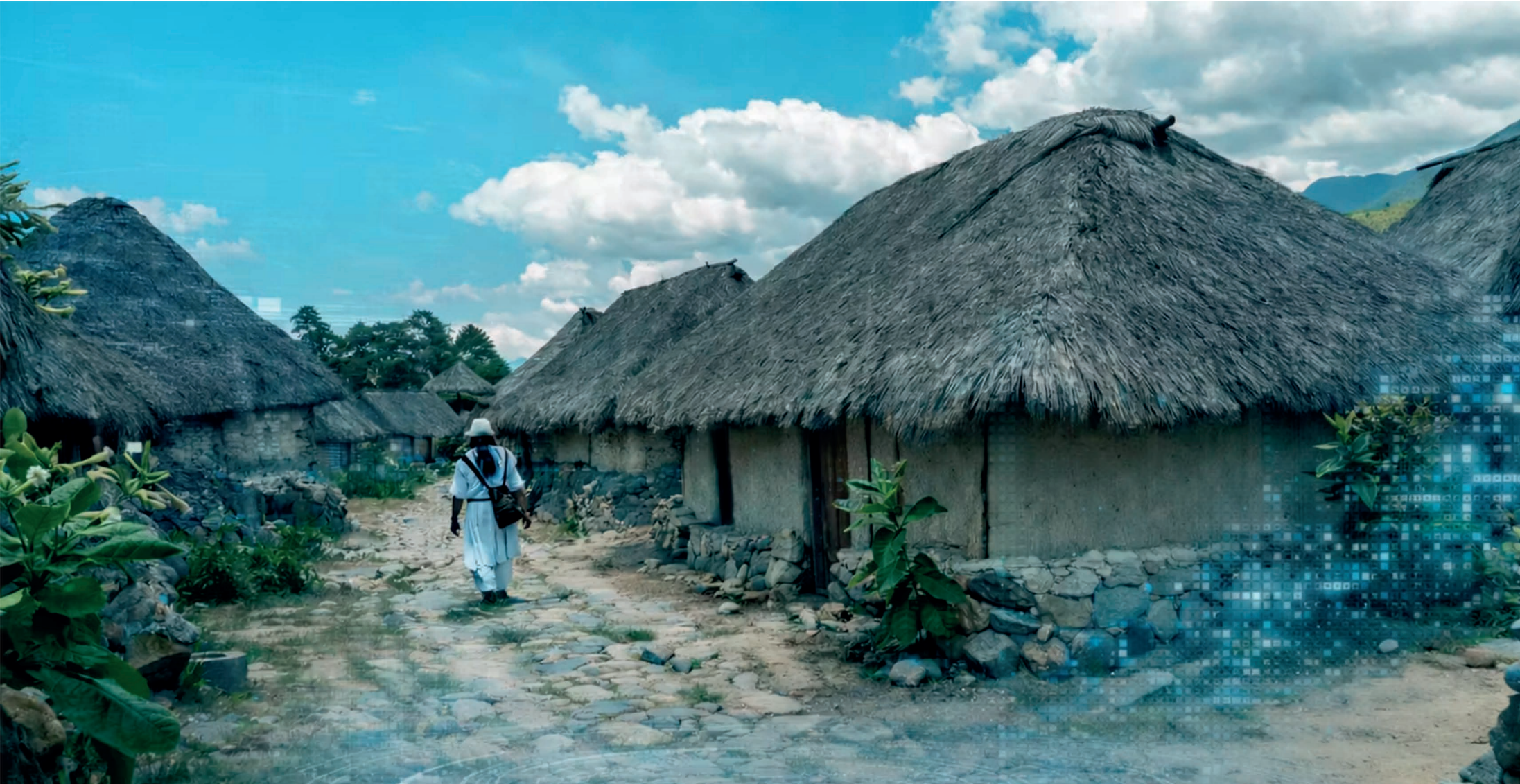
Imagen: Nabusimake. Ilustrativo

La decisión del Consejo de Estado que tumbó el Decreto 1500 de 2018 no solo borró del mapa jurídico los 348 sitios sagrados de los pueblos Arahúaco, Kogui, Wiwa y Kankuamo. Abrió una herida donde confluyen el avance del conflicto armado, la expansión extractiva y la inoperatividad del Estado