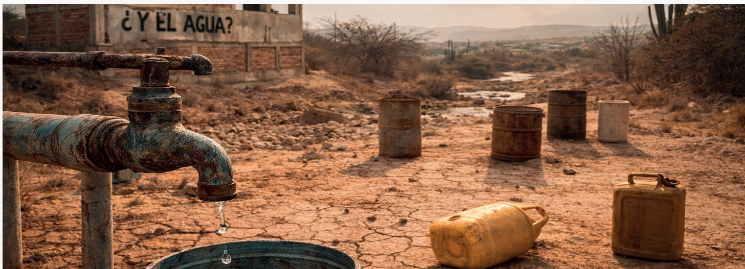
Imagen: Generada con IA

Por: Yeslie Paola Hernández - Corresponsalías Populares La Guajira.