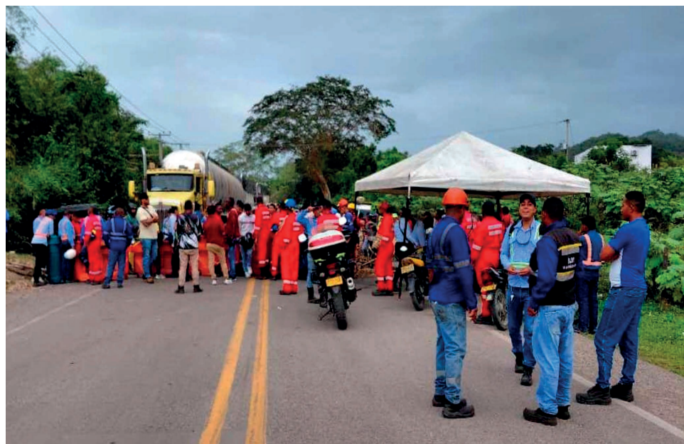
Foto: Protesta por abandono del río Cañas

Mientras tanto, en Río Cañas, el río sigue su curso, pero la vida de quienes dependen de él está en vilo.