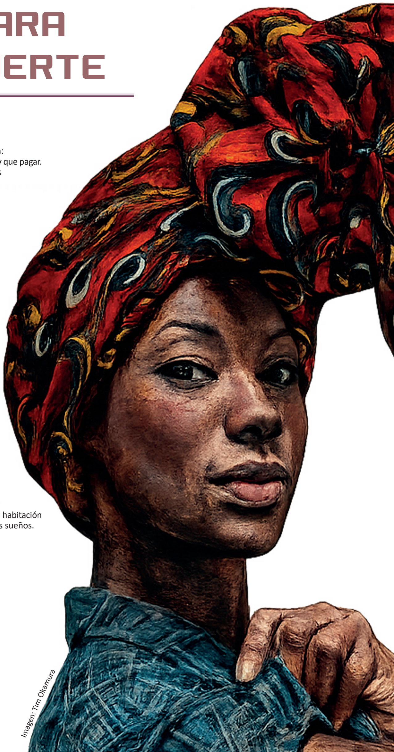
Imagen: Tim Okamura